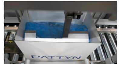
Plegador frontal de bolsa