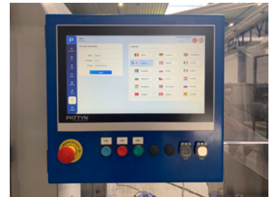
HMI de 15"