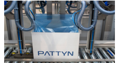
Las placas vuelven a formar los fuelles del film