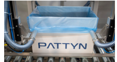
Desplegado de bolsa por vacío (opcional)