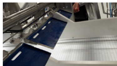
Système de séparation des lots multi portes