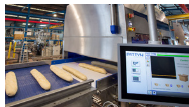
Interface graphique : Argodisplay