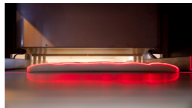
Scan caméra laser