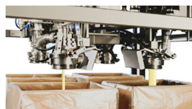
Llenado rápido y lento