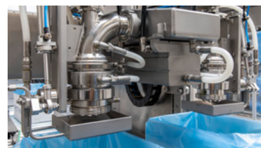
Válvula curvada 90° con receptor de goteo