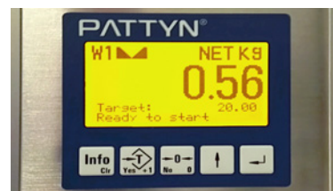
Controlador de pesa de nueva generación