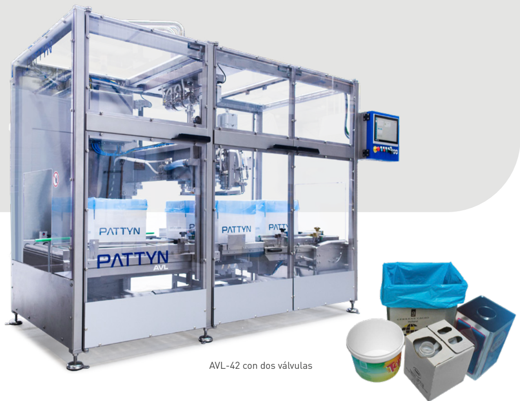
AVL-42 con dos válvulas