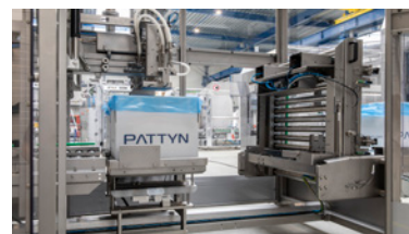
Cinta de alimentación inclinable para una fácil limpieza